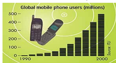
Figura 2 Incremento del número de teléfonos móviles desde 1990.

Uno de los usos que más se ha incrementado en los últimos cinco años es la generalización de la utilización de los teléfonos móviles. Hoy ya son más de 1000 millones de teléfonos los que están funcionando en el planeta.