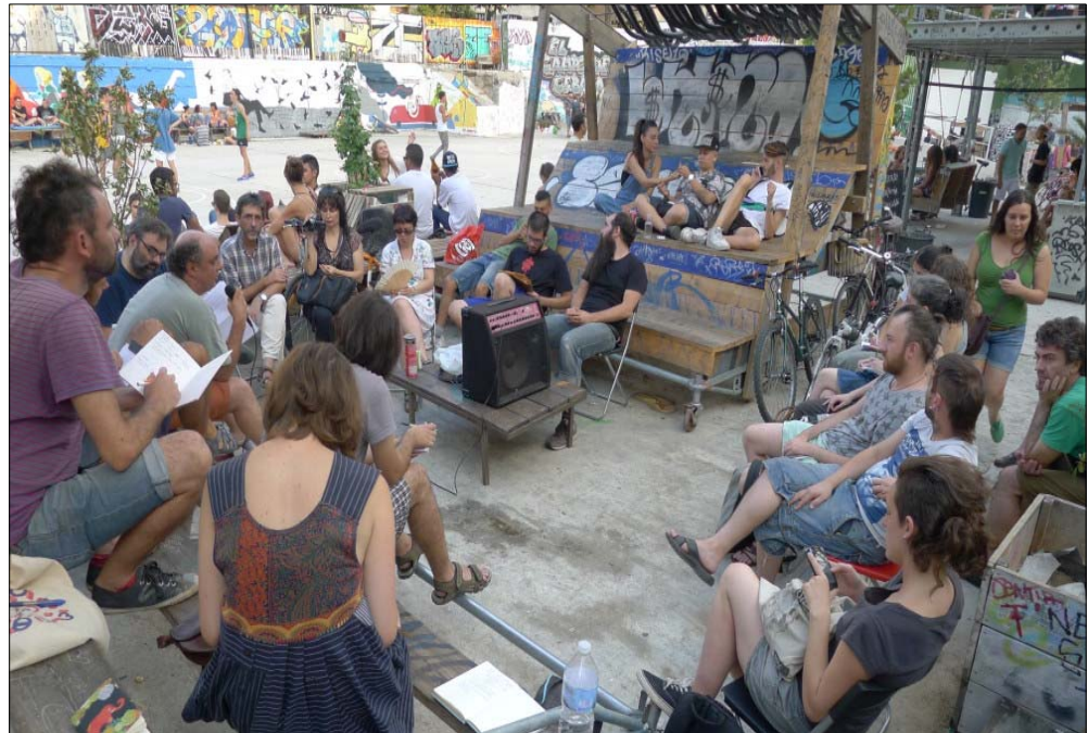
Asamblea vecinal en el Campo de la Cebada (Centro)

Por poner solo algunos ejemplos de este tipo de labor en estos años, se dio soporte a nuevos colectivos surgidos en Boadilla del Monte, Humanes, Pozuelo de Alarcón (Asociación Vecinal Los Horcajos-La Estación), Las Rozas (Asociación Vecinal Ágora), Manzanares el Real, Rivas, Galapagar (Asociación Vecinal Colonia España) o en el barrio de Ciudad Pegaso del distrito de San Blas.