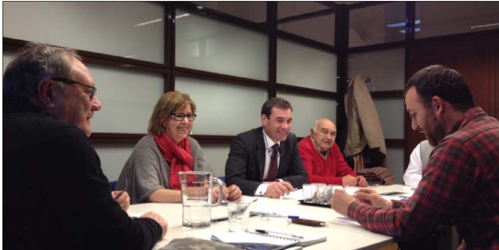
Presentación del documento de demandas ciudadanas a los representantes del PSM-PSOE

Fruto del III Encuentro Vecinal las organizaciones participantes elaboraron un documento de conclusiones y propuestas que fueron expuestas durante los meses de enero y febrero de 2015 a los partidos que se postularon las elecciones municipales y autonómicas. En el ANEXO 1 de esta memoria incluimos este documento de demandas ciudadanas en su totalidad.