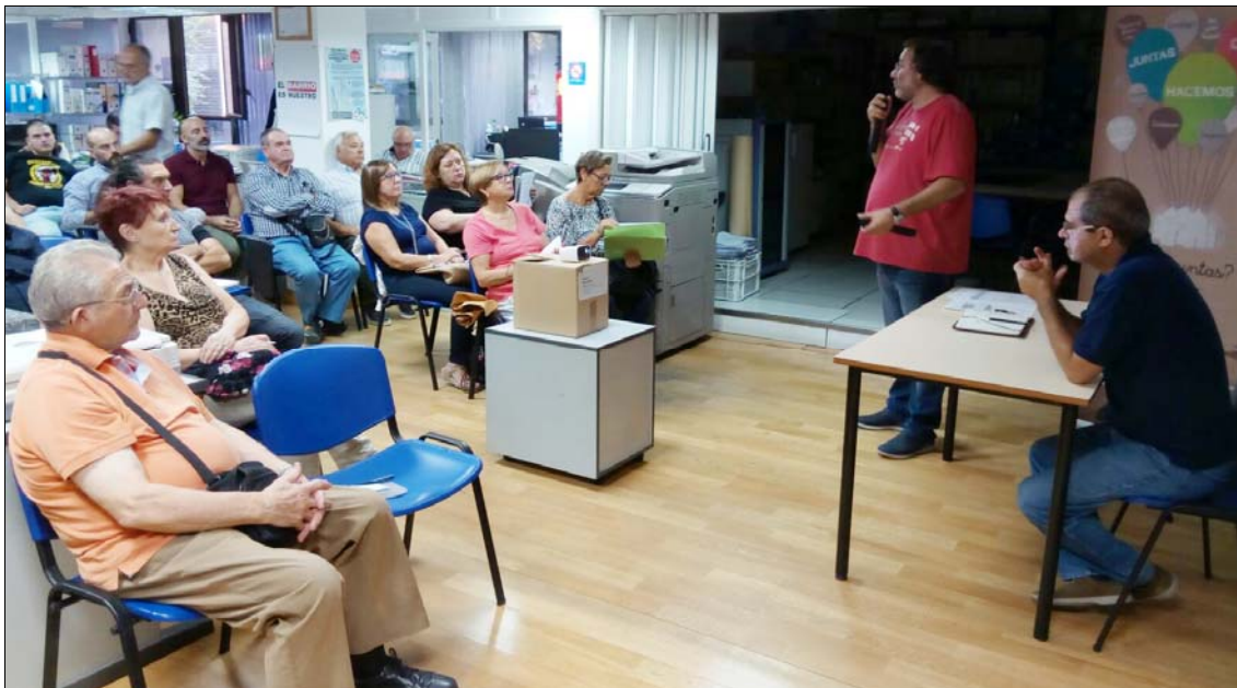
Asamblea monográfica sobre limpieza y mantenimiento de zonas verdes

A esta asamblea (más abajo) asistieron más de 150 personas de 64 de asociaciones, que acordaron las principales líneas de acción de la federación: el empleo, el reequilibrio territorial, la mejora de la red de equipamientos públicos, el rescate y profundización de los pilares de la sociedad del bienestar (sanidad, educación, dependencia y vivienda), la defensa de lo público, la sostenibilidad urbana y la calidad de la democracia.