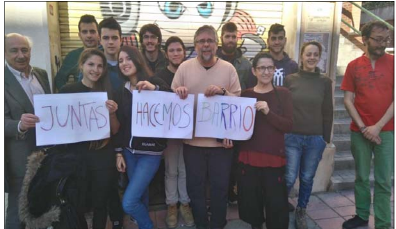
AV La Flor del Barrio del Pilar (Fuencarral-El Pardo)