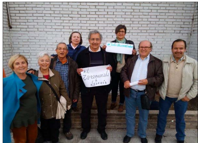
AV Zarzaquemada de Leganés