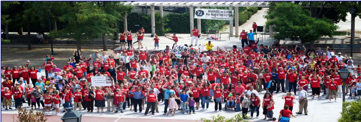
Concentración del 7J en Orcasitas

Finalmente, el sábado 7 de junio decenas de asociaciones vecinales, colectivos de barrio y organizaciones sociales llevaron a cabo casi 30 acciones en 19 distritos de la capital y en siete municipios de la región para exigir a las administraciones que destinaran los presupuestos a mejorar los servicios públicos y a dignificar las condiciones de vida de una ciudadanía castigada por el paro.