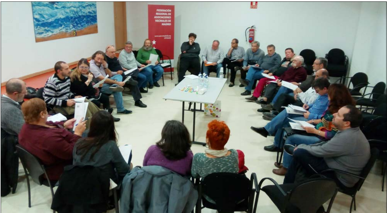
Reunión de la junta directiva de la FRAVM en San Fernando de Henares

Como viene siendo habitual, la actividad de los órganos de gobierno de la FRAVM se desarrolló a través de sus reuniones ordinarias, mensuales en el caso de la junta directiva, semanales en el de la comisión permanente y anuales en el de las asambleas generales de la organización.