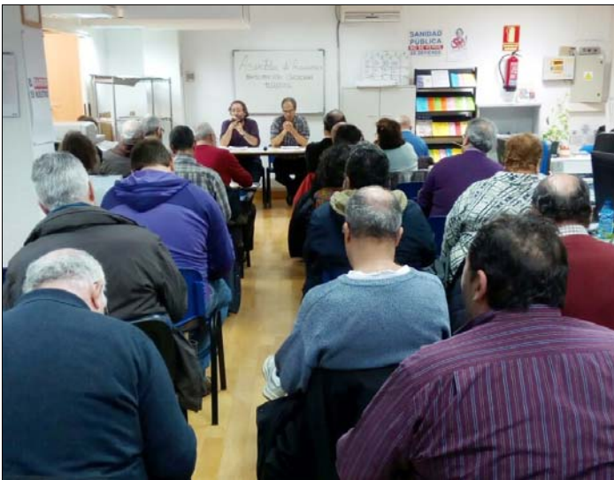
Asamblea de AAVV sobre participación ciudadana en la sede de la FRAVM. 11/02/16

Respecto a la cesión de espacios públicos para el desarrollo de proyectos vecinales, se han producido algunos avances en este trienio, que arrancó con la puesta en marcha, en 2014, de la red Hacenderas, un espacio de intercambio y reflexión de proyectos ciudadanos de la capital, muchos de los cuales se ubican en locales autogestionados. Aunque la red había desaparecido en 2015, la FRAVM continuó apoyando los procesos de recuperación y uso autogestionado de inmuebles y parcelas públicas , tanto los veteranos como el Campo de la Cebada (Centro), el Centro Social Seco (Retiro), el Espacio Vecinal Montamarta (San Blas), el Centro Social Mariano Muñoz (Usera) o el Patio Maravillas (Centro) como los que se pusieron en marcha en estos tres años. Proyectos estos últimos como el Espacio Vecinal Arganzuela (EVA), el Centro de Iniciativas Vecinales de San Cristóbal, el Espacio Vecinal de Hortaleza o la Plataforma Rosa Agazzi de Majadahonda, cuyos promotores pelearon por la cesión de locales en desuso propiedad de la administración con objeto de dar vida a centros sociales abiertos al barrio y a la ciudad. Iniciativas que, en el caso de la capital, se toparon con un nuevo Reglamento de Cesión de Espacios Públicos municipal que, aunque histórico, resulta insuficiente para atender la demanda existente.