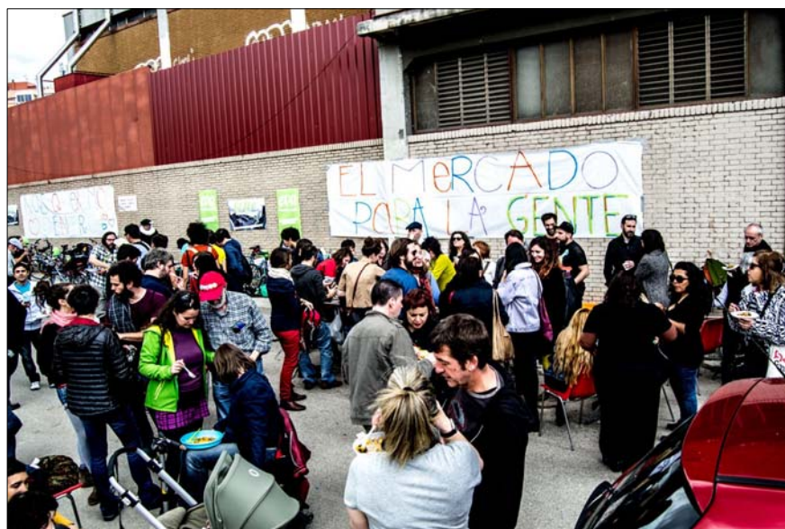
Tras una larga batalla, los colectivos vecinales de Arganzuela consiguieron la promesa de cesión de una parte del antiguo mercado de frutas