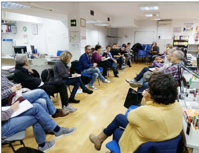
Sede de la FRAVM, en el Camino de los Vinateros, 53, Madrid