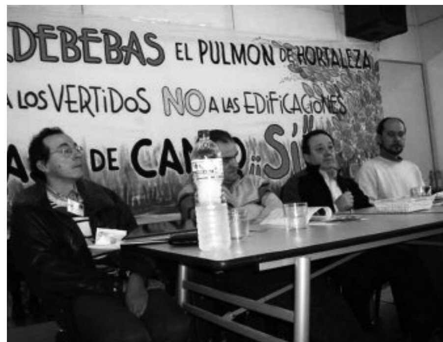
Charla informativa, el pasado 25 de Febrero.