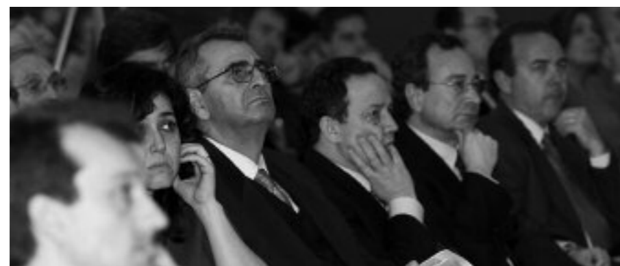
Asistentes a la presentación del OCTA.

Las consecuencias del incumplimiento del código de autorregulación son más graves de lo que pueda parecer. Las niñas y niños españoles pasan delante de la televisión más de tres horas al día. La “caja tonta” ha llegado a convertirse en un agente socializador más y, aunque las cadenas asumen sobre el papel el compromiso de no incluir mensajes que fomenten la discriminación por nacimiento, raza, sexo, religión..., el OCTA ha constatado que continúan reflejando actitudes y comportamientos sexistas. Hay, asimismo, una sobredimensión de mensajes que fomentan la competitividad y el arribismo exacerbados, muestran actitudes violentas, verbales y físicas y manifestaciones sexuales explícitas. En algunos programas que se emiten en horario infantil, estos incumplimientos no son casuales o puntuales, sino reiterados y continuos, de manera que el Observatorio tiene aún un largo camino que recorrer para “enseñar a desaprender” esta forma de hacer televisión.