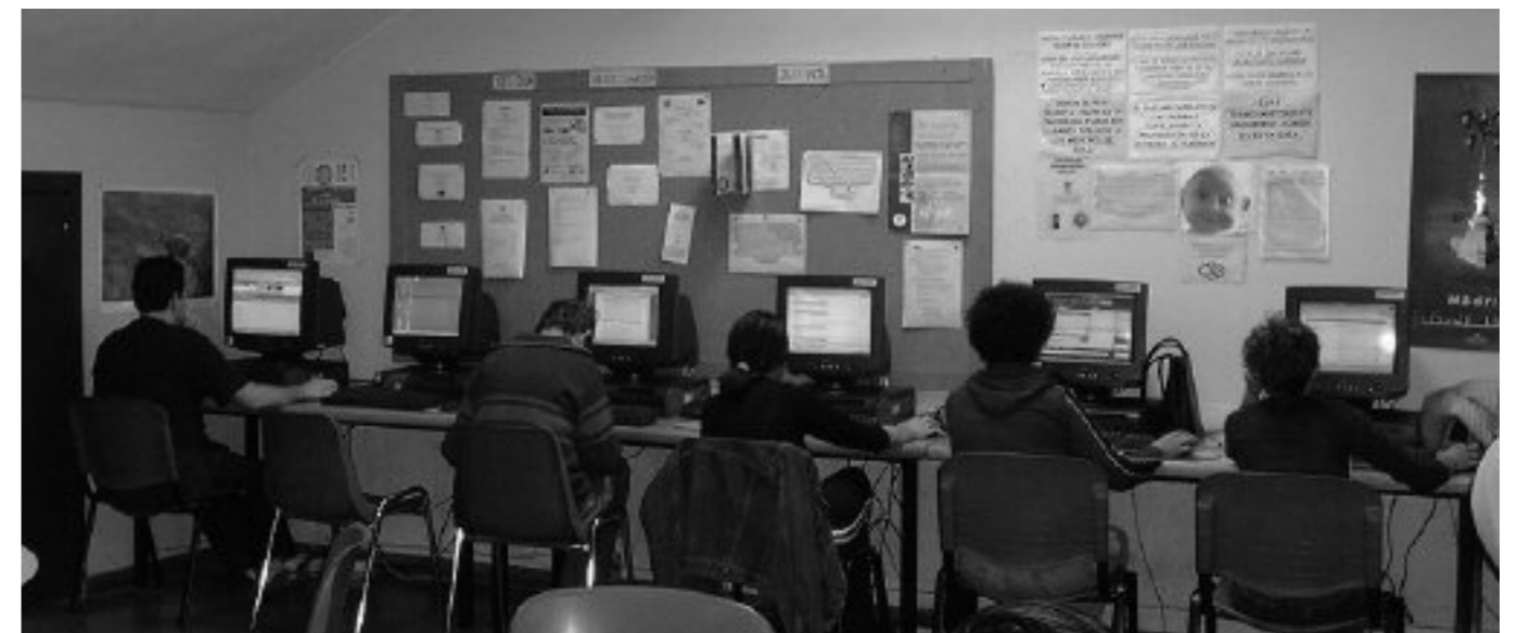
Imagen de una sala del centro del Proyecto San Fermín

El proyecto se lleva a cabo en las instalaciones de la A.V. Cornisa de Orcasitas, Proyecto San Fermín y la Fundación Iniciativas Sur de la Meseta de Orcasitas, asociaciones que, junto con la Federación, acogen las diferentes fases por las que pasan las personas usuarias y que han puesto sus instalaciones, recursos y personal a disposición de un proyecto cuyo objetivo final es que, al menos, 51 personas consigan empleo por seis o más meses antes de diciembre de 2006 y que cientos de ellos mejoren sustancialmente sus posibilidades de hallar ese empleo.