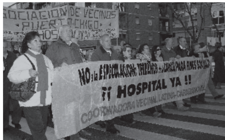
Cabecera de la manifestación celebrada el pasado 1 de marzo.

En el manifiesto leído al término de la manifestación, los portavoces de la Coordinadora de Latina recordaron que la construcción de un hospital en los terrenos de la cárcel requiere la concertación de las tres administraciones, por lo que pidieron "al ministerio del Interior, propietario de los terrenos, que ceda la parcela al Ayuntamiento de Madrid; que éste modifique el Plan General de Ordenación Urbana de Madrid, de 1997, que prevé la construcción de 1.300 viviendas de renta libre en la parcela demandada, cambiando el uso de residencial a dotacional y, finalmente, que la Comunidad de Madrid adquiere el compromiso de construir el hospital". Reclamaron asimismo, que el hospital militar Gómez Ulla pase también a ser de referencia para los vecinos de Latina y Carabanchel y, en caso de que fuera suficiente para atender la demanda, que los terrenos de la antigua prisión se destinen a la construcción de otros equipamientos públicos.