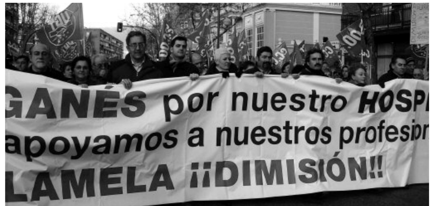
Cabecera de la manifestación que tuvo lugar en Leganés el pasado 3 de marzo.

médicos cesados, la mejora de los servicios de urgencias del hospital en otorrinolaringología, oftalmología, cirugía dental y cardiología y la puesta en marcha de la unidad de cuidados paliativos en el Severo Ochoa.