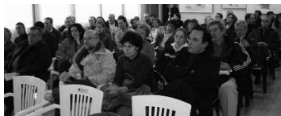
Vecinos y vecinas de Hortaleza.

Durante el proceso de revisión del Plan General de Ordenación Urbana de Madrid (PGOUM) de 1985, las entidades vecinales presentaron alegaciones para que este espacio fuera clasificado como suelo no