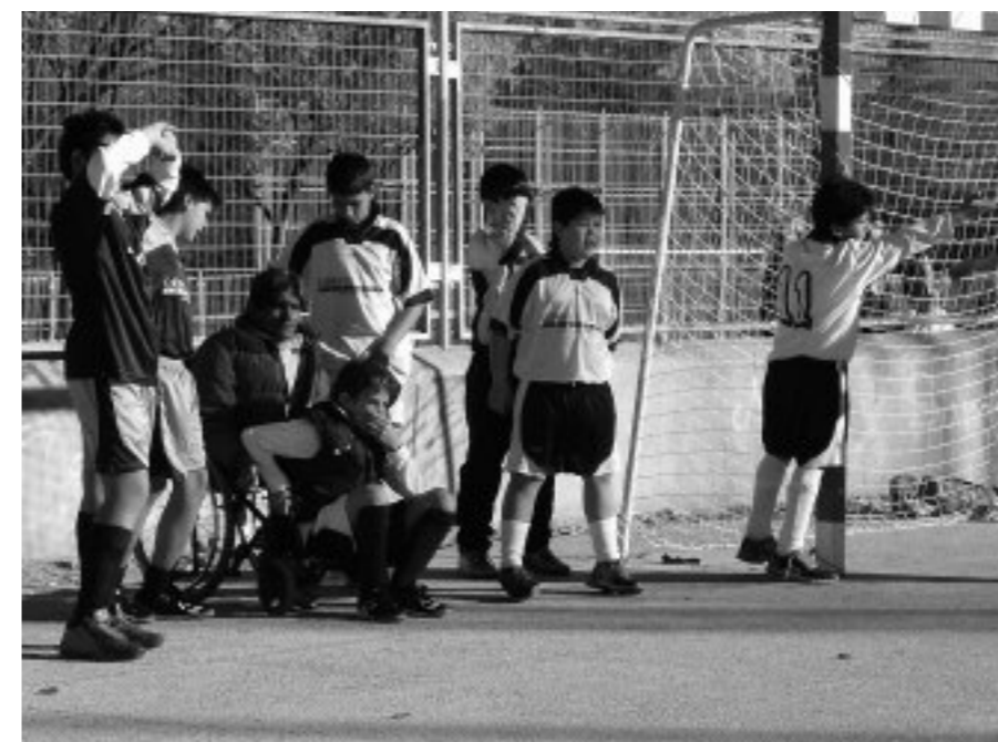
La intervención con los más pequeños, fundamental en la labor de prevención.

En este rodaje, la experiencia de las asociaciones vecinales ha sido fundamental. A su metodología de acción,