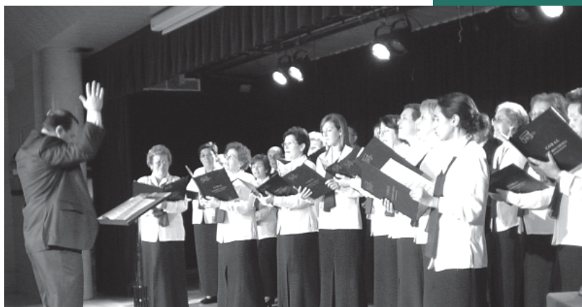
A.V. Villa Rosa

En 1994 la A.V. Villa Rosa se aventuró a dar a luz una iniciativa que ha celebrado este año su decimoprimer aniversario y que constituye uno de los escasos certámenes corales de la región.