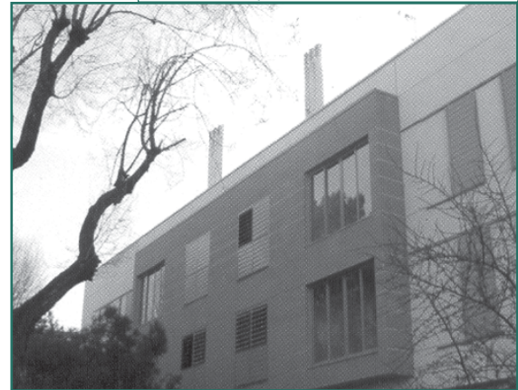
Bloque 214 remodelado, en San Cristóbal.

de San Cristóbal y de la FRAVM, entre ellos su responsable de Urbanismo y Vivienda, Prisciliano Castro.