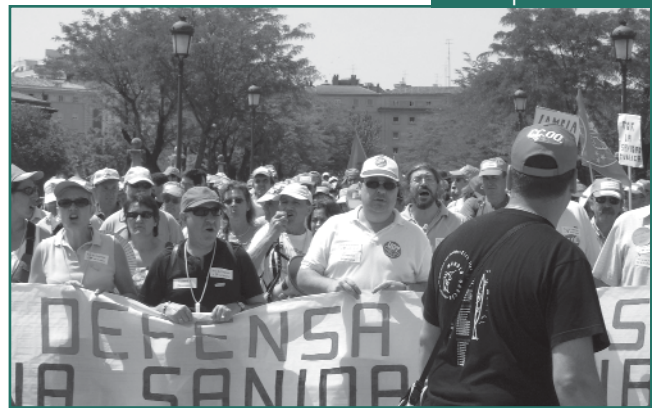
Imagen de la Marcha por la dignidad