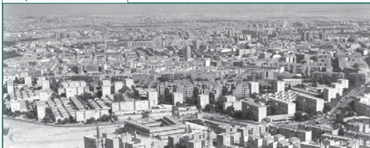
Vista panorámica de Caño Roto

>> Suma y sigue. En breve los barrios de Ventilla-Almenara (Tetuán), Embajadores (Centro) y Comillas (Carabanchel) contarán con la presencia y el trabajo de los mediadores vecinales. El proyecto, como vemos, no deja de crecer.