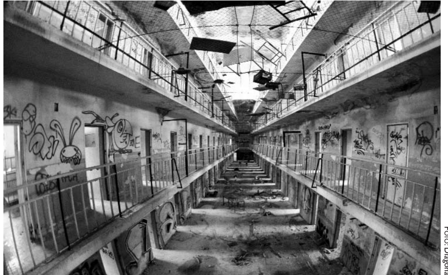
Los vecinos reclaman que la totalidad de los terrenos de la cárcel se destinen a equipamientos sociales

Respecto al resto de la superficie, el Ministerio mantendrá la comisaría y el Centro de Internamiento para Extranjeros ya existentes y creará nuevas dotaciones para Instituciones Penitenciarias. En total, la dirección de prisiones dispondrá de 12.000 metros cuadrados para oficinas y despachos, unas dotaciones que los responsables gubernamentales han "vendido" como equipamientos sociales para la zona, denuncian las asociaciones vecinales de