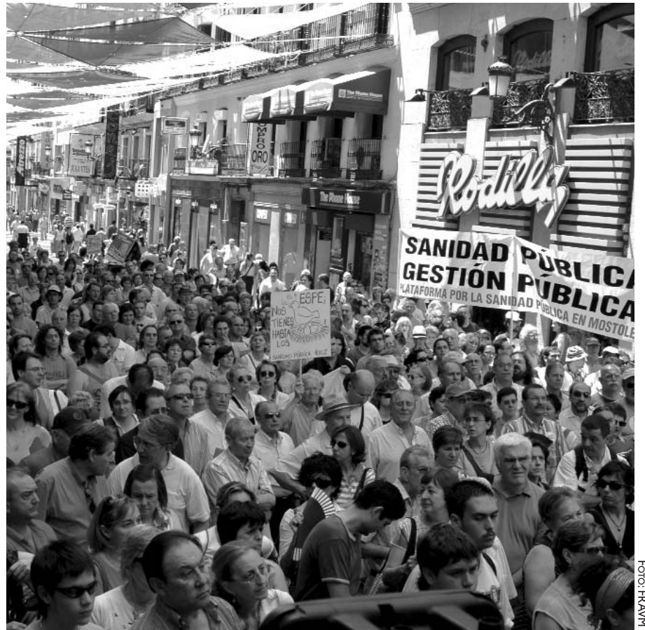
Asamblea ciudadana pública celebrada en Callao el 29 de junio pasado.

Las asociaciones de vecinos que en su día lucharon por la conquista de los derechos de ciudadanía y por la provi-