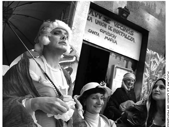
La aristocracia vecinal de Hortaleza se movilizó el 8 de junio para defender las zonas verdes amenazadas por el proyecto de la gasolinera.

Las vecinas y vecinos de Hortaleza denuncian que “la gasolinera se instalará junto a equipamientos sensibles, como un colegio, un instituto, una piscina pública, varios bloques de viviendas, un polideportivo, un club de fútbol, un parque infantil y el carril bici. Además, el surtidor destruirá parte de un pasillo verde que comienza en el espacio protegido del Pinar del Rey y que atraviesa el parque de Doña Guiomar hasta llegar a la estación de Hortaleza, enlazando allí con el carril bici y obligará a trasladar o a reducir el espacio en el que todos los domingos, desde hace 25 años, se instala un mercadillo al que todas las semanas acuden centenares de personas de todas las edades”. La asociación veci-