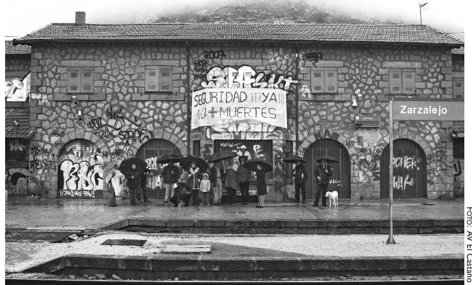
Zarzalejo pide medidas de seguridad para impedir más atropellos.

Las vecinas y vecinos consideran que "la situación es muy grave y que las instancias responsables deben tomar de inmediato las medidas necesarias que garanticen seguridad al usuario sin ningún tipo de riesgo para utilizar este medio público de transporte".