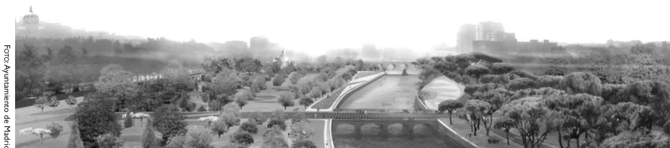
Así proyecta el Ayuntamiento de Madrid el futuro de los márgenes del río Manzanares.

Estudiada la documentación recibida, el Ayuntamiento de Madrid consideró más o menos el 50% de las alegaciones vecinales recibidas correspondientes al ámbito. Del plan aprobado definitivamente en el pleno municipal del mes de junio, quedó excluida la Casa de Campo, tal y como pedían las asociaciones, pero, a su juicio, el Ayuntamiento de la capital ha desaprovechado una ocasión única para dotar a los barrios de los equipamientos públicos necesarios para avanzar en el reequilibrio social y territorial de la capital en su afán por construir grandes infraestructuras de uso metropolitano.