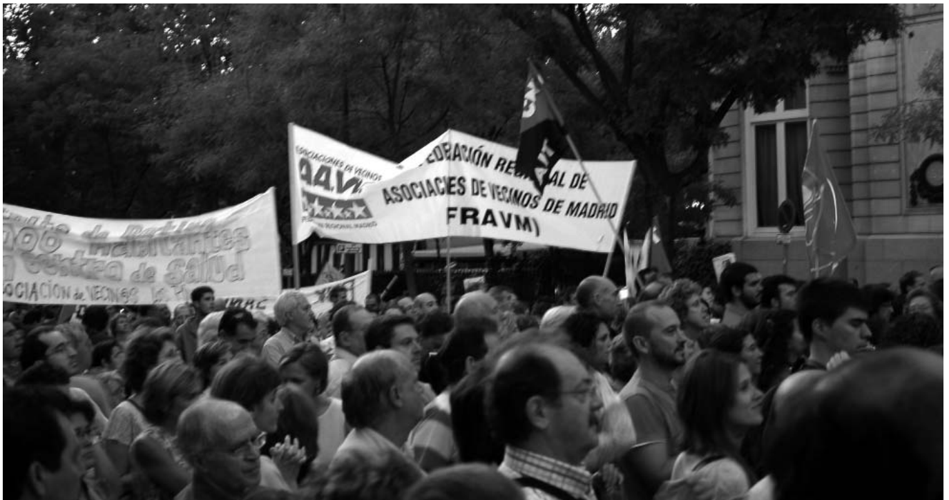
23 de septiembre. Más de 2.000 personas protestan frente al hotel Ritz contra la venta de la sanidad pública madrileña al sector privado.

Desde hace meses, el expolio social y la privatización de la sanidad pública que está llevando a cabo de forma evidente el Gobierno de la Comunidad de Madrid están levantando a su paso una sonora estela de movilizaciones. El pasado 29 de abril, más de 3.000 personas participaron en una veintena de acciones reivindicativas celebradas de forma simultánea en Vallecas, Retiro, Moncloa, Villaverde, Usera, Tetuán, San Blas, Carabanchel, Leganés y Coslada a iniciativa de las asociaciones vecinales. Dos meses después, la FRAVM y la Federación de Asociaciones para la Defensa de la Sanidad Pública Madrileña convocaron una asamblea ciudadana en la plaza de Callao. El 23 de septiembre las asociaciones vecinales y varias organizaciones sindicales denunciaron la venta de las "oportunidades de negocio" del plan de infraestructuras sanitarias a los empresarios por encima de las necesidades de la ciudadanía.