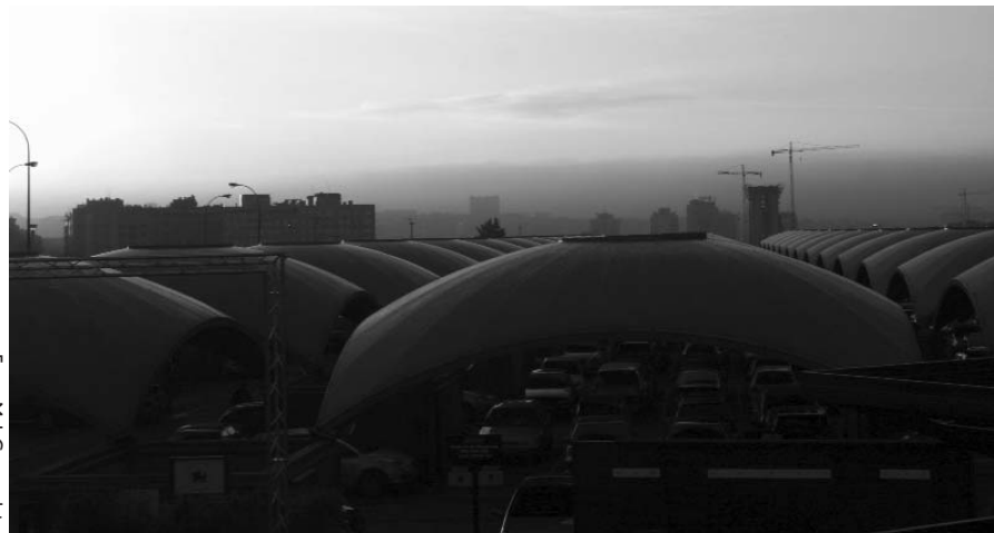
Estación de Atocha, con Vallecas al fondo.

Por todo lo anterior, las asociaciones vecinales solicitan la retirada del proyecto de implantación de la doble vía del AVE y una mayor optimización de las infraestructuras ferroviarias ya existentes e instan a las administraciones estatal, regional y local a que ejerzan la colaboración, cooperación y coordinación necesarias para buscar de manera conjunta una solución o las alternativas que menores daños causen a los territorios, a los municipios y a los ciudadanos y ciudadanas. La falta de concertación, recuerdan, conduce a ampliar ilimitadamente las propuestas de actuación, a incrementar la ocupación del espacio público y a agravar las afecciones medioambientales.