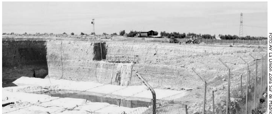
La mina extrae glauberita, un mineral utilizado para la producción de jabones.

Las familias damnificadas, que hasta el momento han sufragado todas las reparaciones, exigen a “Sulquisa y a los organismos competentes que les sean compensados y reparados los perjuicios ocasionados” y, por supuesto, que se solucione de manera permanente algo que viene de lejos. La mayor parte de las denuncias proceden de las urbanizaciones Los Cohonares y Los Almendros, aunque los desperfectos han afectado a otros núcleos urbanos de Chinchón, Villaconejos y, en menor medida,