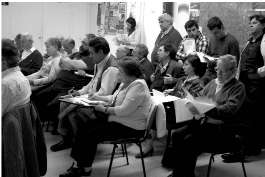
Asamblea monográfica celebrada el pasado 13 de mayo en la FRAVM.

En general, las vecinas y vecinos llamaron la atención sobre lo que consi-