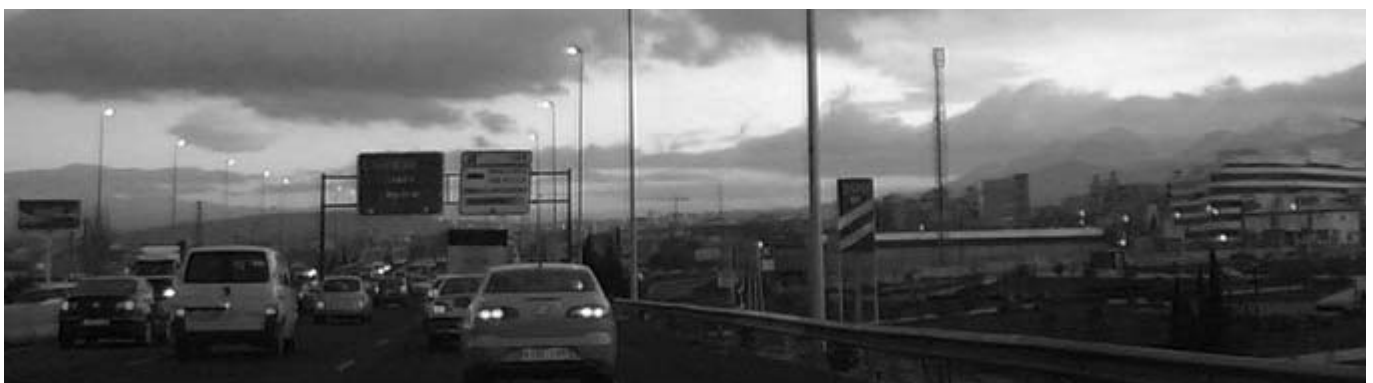
Los opositores al proyecto denuncian que el cierre de la M-50 colapsará la circulación en el barrio de Fuente Lucha de Alcobendas.

El trazado proyectado por el Ejecutivo de Aguirre no sólo afectará a barrios consolidados, sino a desarrollos urbanísticos como el Cerro del Baile, donde el Ayuntamiento de San Sebastián de los Reyes pretende construir 2.000 viviendas, y a futuros equipamientos públicos de la localidad, como los colegios y polideportivos proyectados en Tempranales, una zona en la que, en un futuro no muy lejano, vivirán miles de vecinos.