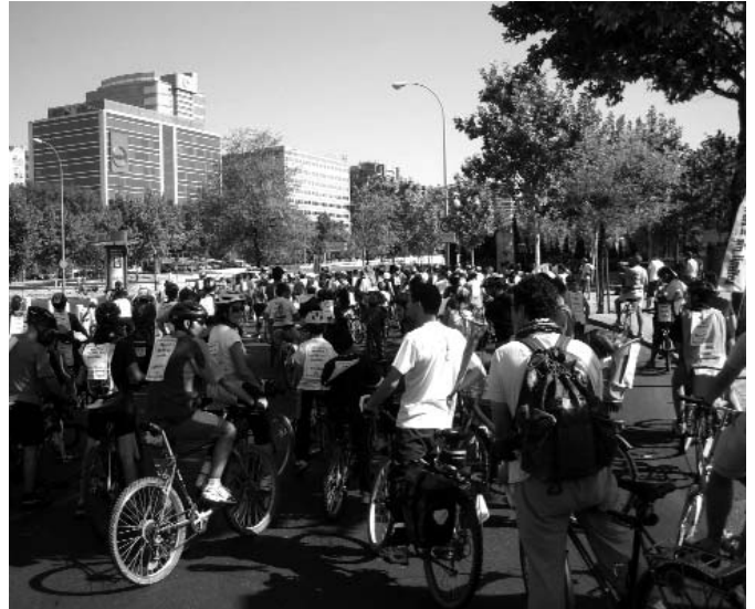
Centenares de ciclistas se dieron cita en la marcha que el 20 de septiembre recorrió parte de los distritos de Fuencarral, Tetuán y Moncloa.

Tras el éxito de la convocatoria del sábado, la asociación El Espinillo de Villaverde y la Coordinadora de Asociaciones Vecinales de Coslada tuvieron que bregar al día siguiente con un tiempo lluvioso y frío, propio de estaciones más tardías, lo que redujo mucho el número de participantes. A pesar del persistente aguacero, decenas de personas marcharon desde el Parque Lineal del Manzanares hasta el Zoo de Madrid, para volver al punto de partida tras recorrer 35 kilómetros. En sintonía con los colectivos de los distritos del Norte, tanto en Villaverde