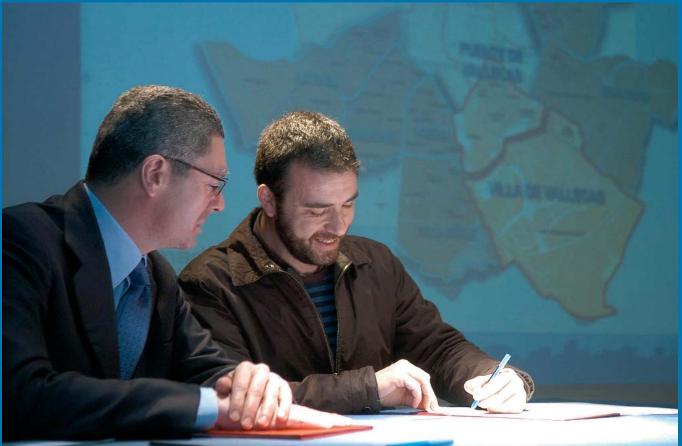
Firma de los Planes Especiales de Inversión y Actuación Territorial 2008-2012 de Puente de Vallecas y Villa de Vallecas.