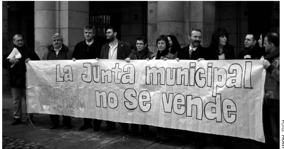
Los representantes vecinales piden que la Casa de la Carnicería se destine a equipamientos públicos.