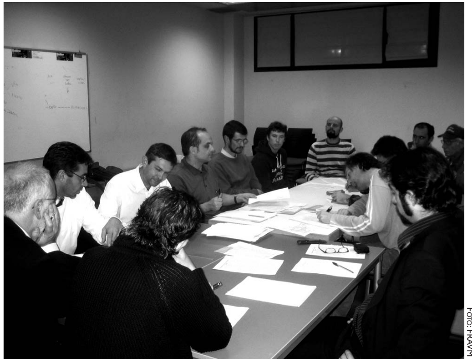
Mesa de constitución de la plataforma ciudadana en Alcalá de Henares.

"El frenético proceso de destrucción que el Henares soporta en su tramo medio y bajo es causado por un modelo de desarrollo totalmente insostenible basado en un urbanismo incontrolado y falto de planificación territorial donde el incumplimiento de la legislación medioambiental es claramente visible por todos los ciudadanos", indica la coordinadora ciudadana en un comunicado de presentación, antes de explicar: "La proliferación de vertidos y escombreras ilegales, la ocupación de los márgenes del río por distintas infraestructuras y construcciones, la modificación artificial de sus orillas y la reducción a la mínima expresión de