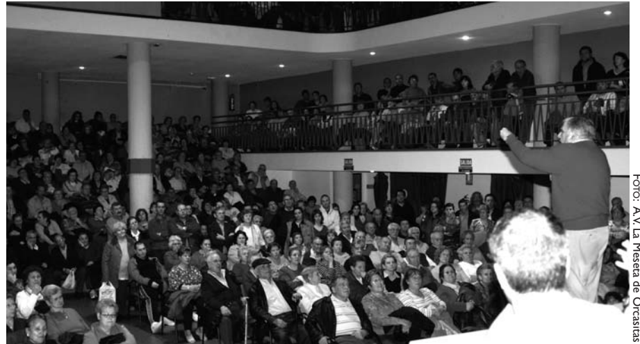
En la imagen, asamblea vecinal en Orcasitas

Ante la negativa del IVIMA, los vecinos, en asambleas de centenares de personas, decidieron manifestarse ante la Asamblea de Madrid.