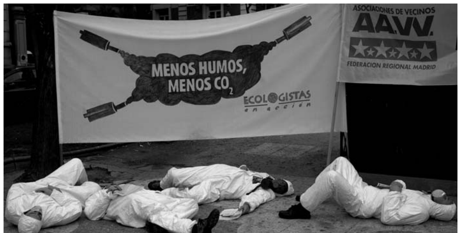
Activistas de la FRAVM y de Ecologistas en Acción piden "menos humos".

Madrid respira con dificultad mientras las medidas contempladas en la Estrategia Local de Calidad del Aire que el Ayuntamiento de Madrid aprobó en 2006 duermen en un cajón el sueño de los justos. La FRAVM y Ecologistas en Acción han exigido a Ana Botella, entre otras medidas, que impulse de forma urgente la reducción del uso del coche y la potenciación del transporte público y no motorizado.