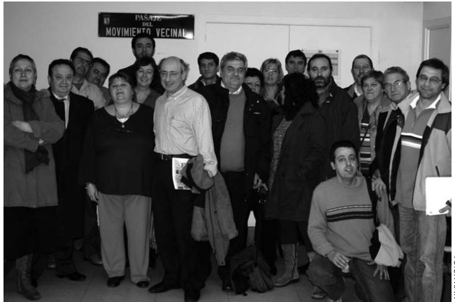
Los veinte miembros de la Junta Directiva, en la sede de la FRAVM

Hasta entonces, sin embargo, los miembros de la Junta coincidieron en señalar algunos objetivos de trabajo, como mejorar la comunicación entre las asociaciones y la Federación; garantizar la independencia política de la organización; feminizar el movimiento vecinal promoviendo el acceso de las