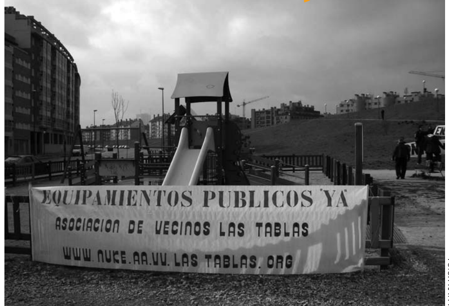
Pancarta desplegada por la A.V. Las Tablas con ocasión del Especulatur.