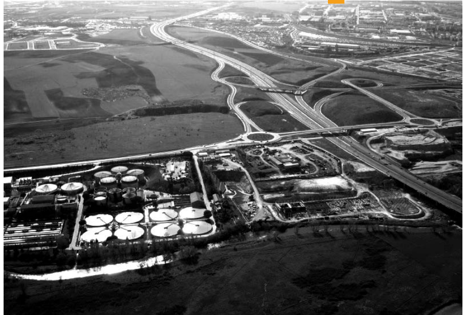
Vista panorámica del barrio de Butarque.

AVIB se opone a que el Ayuntamiento ceda a la Iglesia una parcela del barrio en vez de construir en ella alguno de los equipamientos sociales de los que la zona carece.