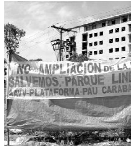
Vecinos del PAU de Carabanchel, contra la ampliación de la M-40

En la reunión de la Comisión de la M-40 del pasado 4 de junio, convocada para estudiar conjuntamente la DIA del arco sur, las asociaciones vecinales manifestaron su profunda decepción y frustración por las, a todas luces, insuficientes "medidas correctoras contra el ruido" y volvieron a solicitar reuniones con los Ministerios de Fomento y Medio Ambiente para insistir en la necesidad del soterramiento en aquellos sectores más afectados por la actual M-40 y su proyecto de ampliación.