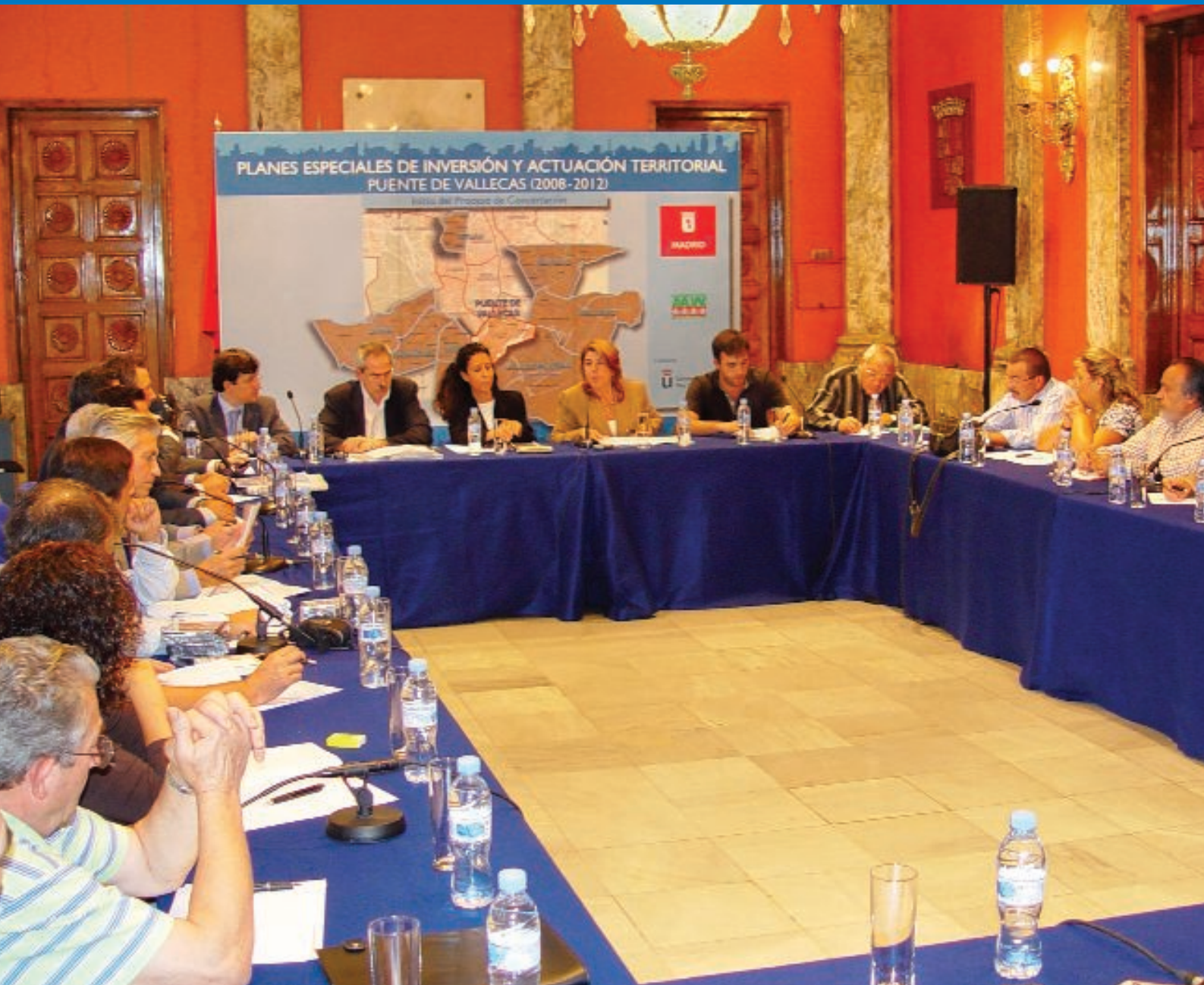
Constitución de la Comisión de Concertación del Plan Especial de Inversiones de Puente de Vallecas.