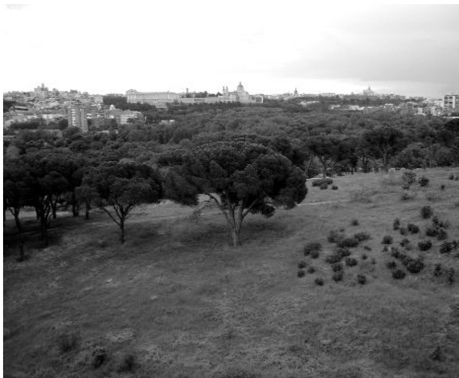
Panorámica de la Casa de Campo.

se ha comprometido a encargar un estudio de conteo de vehículos que atraviesan los señalados viarios para valorar su posible cierre al tráfico y anunció que, tal y como demandamos desde hace años, incorporarán autobuses no contaminantes a la flota que presta servicio en el interior de la Casa de Campo".