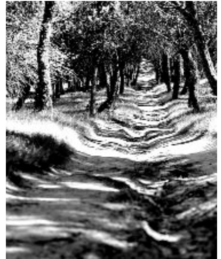
Camino en la Casa de Campo.

Acción, la Coordinadora de Asociaciones de Latina, Marx Madera y la Asociación Salvemos la Casa de Campo, saludaron la adopción de la medida pero advirtieron que, en adelante, "es necesario incrementar las medidas de protección puestas en marcha". Para ello pidieron al Ayuntamiento que garantice la participación de las entidades ciudadanas en la elaboración del Plan de Uso y Gestión de la Casa de Campo para abordar los problemas que impiden la total salvaguarda de este espacio verde en una reunión que mantuvieron con Ana Botella, responsable del Área de Medio Ambiente, el pasado 22 de octubre. Esta aseguró que el Plan se someterá a información pública a finales de este año o principios del próximo y limitó la participación de las entidades ciudadanas y ecologistas a