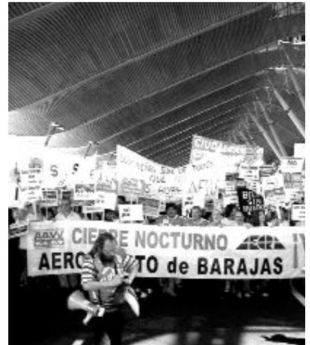
Manifestación vecinal para reivindicar el cierre nocturno del aeropuerto.