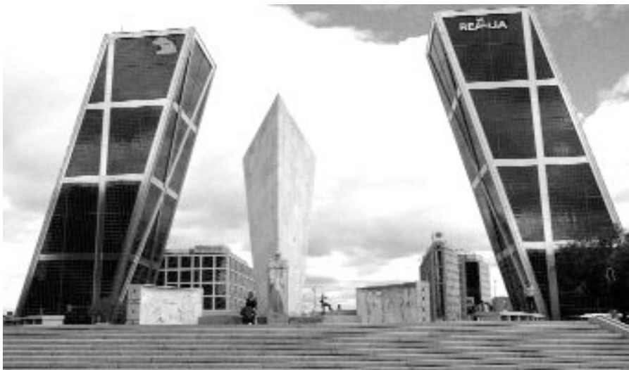
Imagen de la Plaza de Castilla en Madrid.

La calidad del aire en muchas ciudades europeas está lejos de cumplir unos niveles que sean inocuos para la población. Al contrario, desde fuentes oficiales de la Unión Europea se reconoce que unas 370.000 personas fallecen cada año de forma prematura a causa de la mala calidad del aire que respiran.