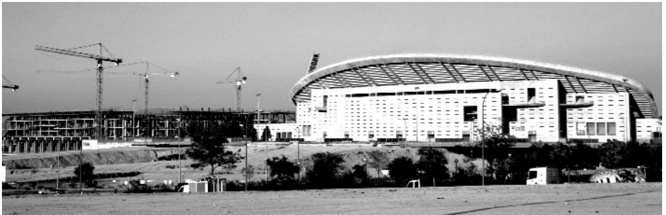
Imagen del estadio de La Peineta.

La FRAVM y la Coordinadora Vecinal de San Blas han puesto de manifiesto su rotundo rechazo a la cesión del estadio público de La Peineta al Atlético de Madrid, así como el “regalo” que el Ayuntamiento hace a la empresa Mahou en el marco del desarrollo urbanístico del ámbito “Mahou Vicente Calderón”. Advierten que la operación provocará graves problemas de movilidad en San Blas y demandan la realización de una consulta ciudadana.