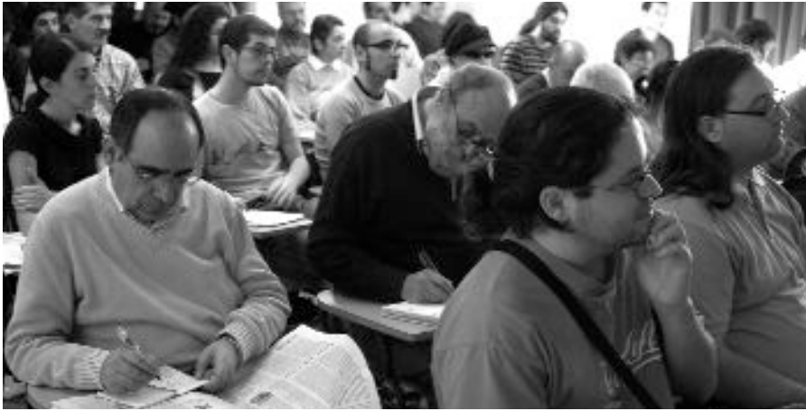
En la imagen, acto de clausura de la Convención.

La Convención de Movimientos Sociales de Madrid celebrada a iniciativa de la FRAVM a finales de octubre cumplió con creces las expectativas de la organización. Hacía mucho tiempo que el movimiento vecinal de Madrid, que el año que viene cumplirá 40 años, no se mezclaba con tantas y tan diversas organizaciones sociales en un mismo espacio de debate. Junto a miembros de 23 asociaciones de vecinos de diferentes barrios de Madrid, participaron en el evento sindicalistas de centrales como CGT y CC OO; medios como Nodo 50, la Unión de Radios Comunitarias de Madrid y el periódico Diagonal y organizaciones como Ecologistas en Acción, ATTAC, la FAPA Giner de los Ríos, CEAR, el Centro Social Okupado Patio de las Maravillas, o la Unión de Cooperativas Madrileñas de Trabajo Asociado (UCMTA).