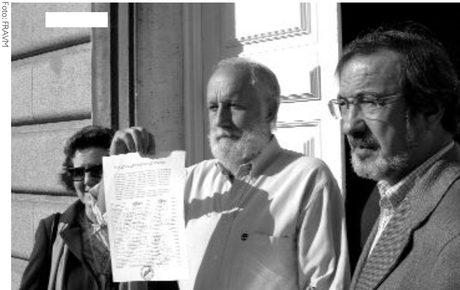
Entrega de las 1000 primeras firmas contra la venta de la iglesia en el Arzobispado de Madrid.

El Arzobispado ha decidido vender al mejor postor la parcela de una antigua parroquia de Alameda de Osuna (Barajas) que en su momento fue donada por una empresa constructora. Los vecinos demandan a la Iglesia la cesión de los terrenos para construir equipamientos sociales de los que el barrio carece. La curia, de momento, se niega a recibir a los representantes vecinales.