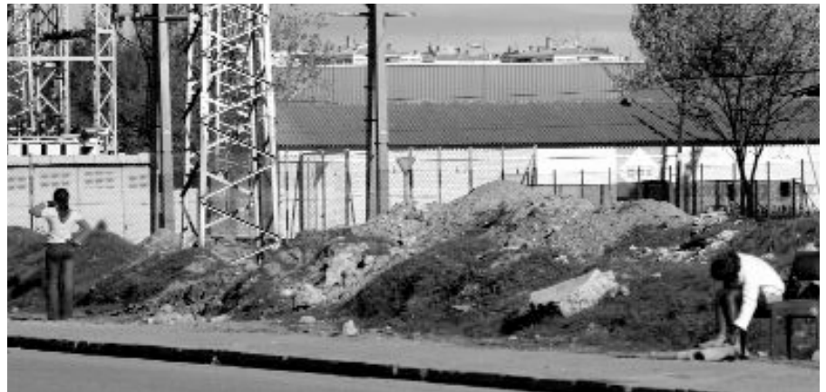
Dos prostitutas, en la colonia de Marconi.