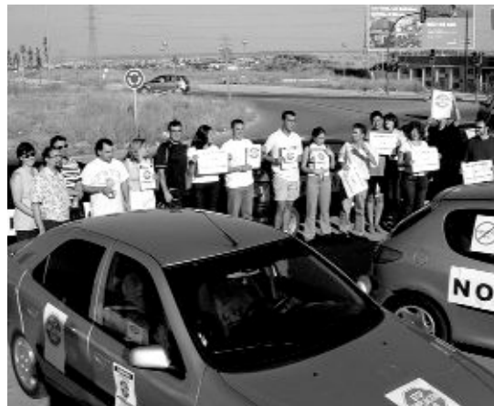
Protesta contra la ampliación de la carretera en el mes de julio del pasado 2003.

El proyecto de ampliación de la M-40 afecta, entre otras zonas verdes, al Monte de El Pardo, al Parque Regional de la Cuenca Alta del Manzanares y al Monte de El Pilar.