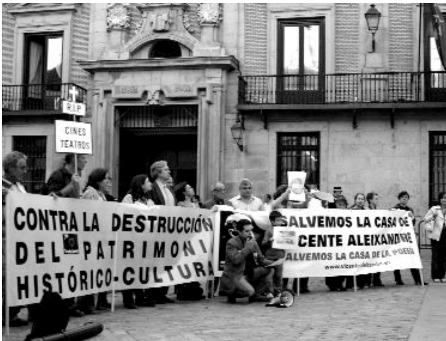
Concentración el pasado 18 de octubre en la Plaza de la Villa.

Entre el polvo levantado por las grandes obras viarias y la lucrativa fiebre de la construcción, se consume, lenta pero irreversiblemente, el deterioro del patrimonio cultural e histórico del centro de la capital. En los últimos años, se han clausurado un total de cuarenta cines. Dieciocho de ellos desde 2003. El Albéniz, uno de nuestros mejores teatros, puede ser derribado en breve para ser sustituido por pisos de lujo. Hace tiempo que los teatros Arniches, Cómico y Martín bajaron definitivamente el telón y es probable que el esqueleto del Barceló albergue en un futuro un centro comercial. Los oficios tradicionales y artesanos, las librerías centenarias, cafés como el Lyon y tabernas de primer orden como Los Gabrieles y Casa Antonio desaparecen ante el imparable avance de franquicias y tiendas de "Todo a cien" que convierten el centro de Madrid en un espacio de consumo fácil cada vez más ajeno a su propio habitante, pero más cercano a una versión estandarizada de ciudad. En el mejor de los casos, lo