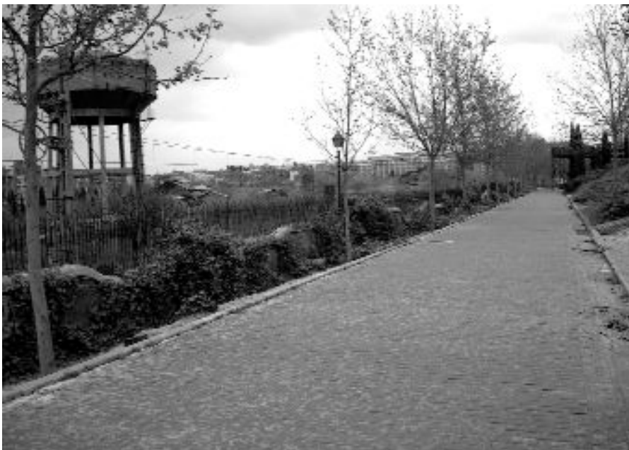
Las vías ferroviarias fracturan la comunicación del Planetario con el resto de la ciudad.

La foto fija de Méndez Álvaro, ubicada en la intersección de los barrios de Delicias, Legazpi y Atocha, en Arganzuela, muestra una zona ubicada en las cercanías de uno de los mayores parques de la ciudad, el Tierno Galván, pero vecina también de infraestructuras como la estación de autobuses y ferrocarril de Méndez Álvaro y la estación de contenedores del Abroñigal, que es el centro logístico de contenedores de RENFE en Madrid.