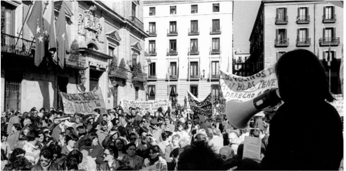
La lucha por una vivienda digna, una constante del movimiento vecinal.

Cuarenta años han dado para parir, nutrir y consolidar un movimiento ciudadano que nació en los años sesenta para dignificar las condiciones de vida de miles de personas llegadas a Madrid para trabajar en las grandes fábricas. Hoy, el movimiento vecinal tiene mucho que celebrar. Por todo lo conquistado y por lo soñado. Y por lo que queda por hacer, por crecer, idear, construir y transformar.