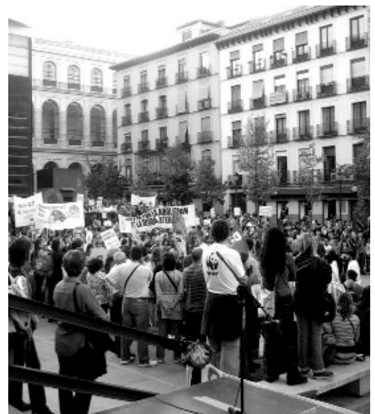
Imágenes de la manifestación contra el cambio climático celebrada el pasado año.