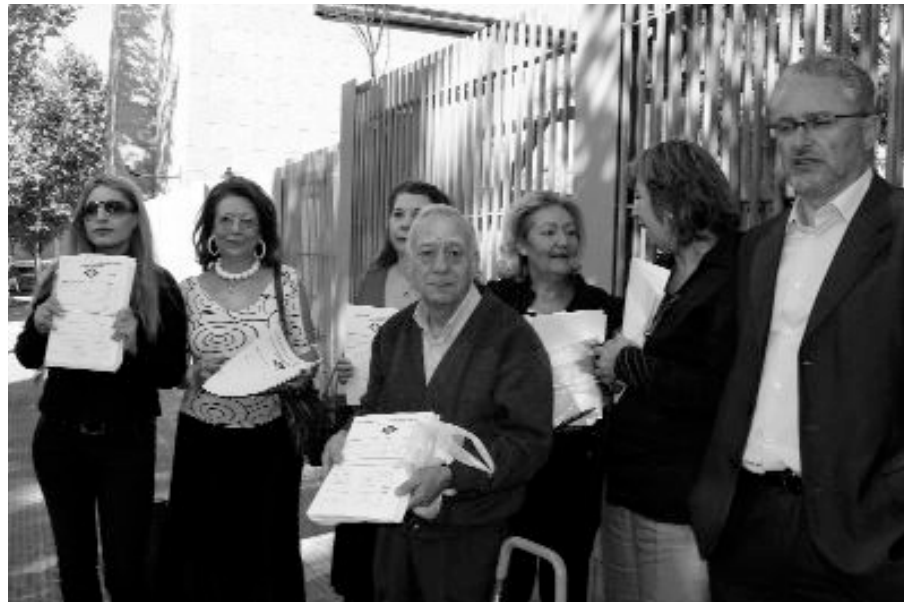
Los representantes vecinales muestran las firmas conseguidas antes de ser entregadas en el registro de la Asamblea de Madrid.

encuentra en un extremo del barrio, por lo que la mayoría de los vecinos se ven obligados a coger el autobús, el coche, o a caminar largas distancias para desplazarse hasta ella. Por ende, se quejan los ciudadanos, el servicio de autobuses se ha deteriorado en los últimos tiempos. Esto afecta, de manera particular, a dos de las tres líneas que funcionan en la zona: "la 58, cuyo pésimo funcionamiento ha provocado múltiples protestas vecinales y la 145, cuya