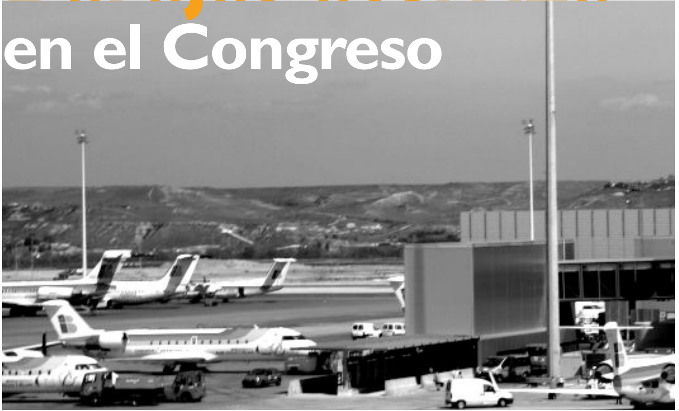
Imagen de la T-4.