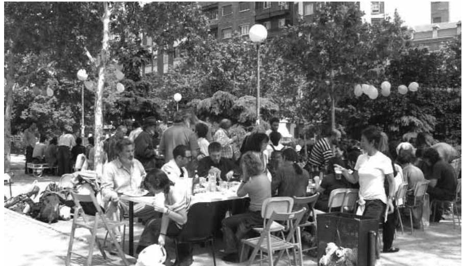
Vecinas y vecinos de La Prospe reivindican el uso público de los espacios públicos.

La postura de la A.V. Valle Inclán es firme. "Estas actuaciones van encaminadas a erradicar la presencia de un tipo de personas que utilizan las plazas y parques para reunirse y divertirse y que, por supuesto no representan amenaza alguna para la seguridad del barrio, pero que no son potenciales consumidores de ocio. En nombre de la seguridad, quieren destruir nuestra plaza y convertirla en un desierto de cemento en un distrito que no es especialmente inseguro. En nombre de la movilidad, quieren construir además un parking bajo el parque y, para colmo, un pequeño polideportivo de pago cuando ya hay uno a 200 metros, el de Pradillo. En cuanto al parking, los vecinos ya