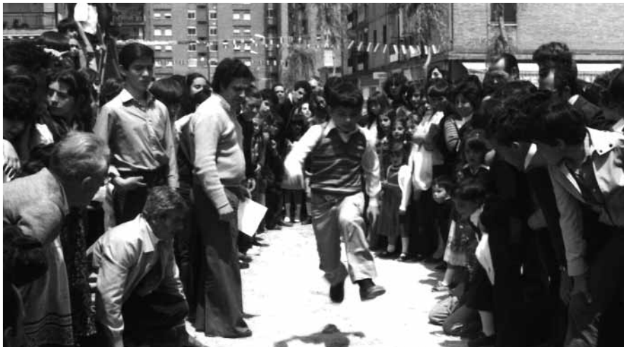
Primer concurso de juegos infantiles del barrio, en 1981.

Esto y mucho más es la A.V. San Nicolás, que ya está escribiendo las primeras páginas del próximo libro. ¡Felicidades!