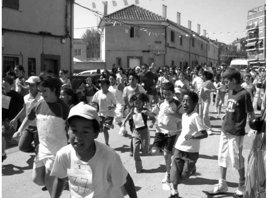
Carrera infantil celebrada en Carabanchel

También durante la primera semana de julio el barrio de Simancas (San Blas) entrará en ebullición con un maratón de