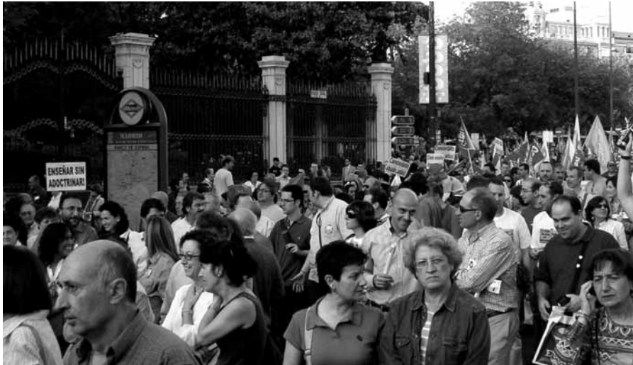
Manifestación en defensa de la Educación pública celebrada el pasado 10 de mayo.