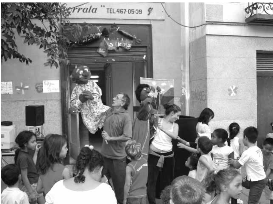
Las niñas y niños, protagonistas absolutos de las fiestas de Lavapies.

Terminamos el recorrido en el barrio de Bilbao, de Ciudad Lineal, donde diversas asociaciones culturales integradas por vecinos procedentes de diferentes países se han sumado a la organización de las fiestas, un hecho que pronto dejará de ser noticia.