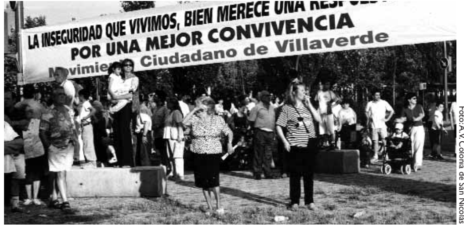
El cruce de Villaverde, punto de encuentro de las entidades del distrito.

La necesidad de dar cobijo a los trabajadores unida a la permisividad y la corrupción del régimen se tradujo en la construcción de enormes barriadas de casas bajas desprovistas de viales y alumbrado público. La de San Nicolás fue una de ellas. Los miembros de la asociación aún recuerdan cómo para salir a la carretera de Villaverde para coger los autobuses urbanos tenían que ir con botas de goma y cambiarse después de calzado para salvarlo del barro.