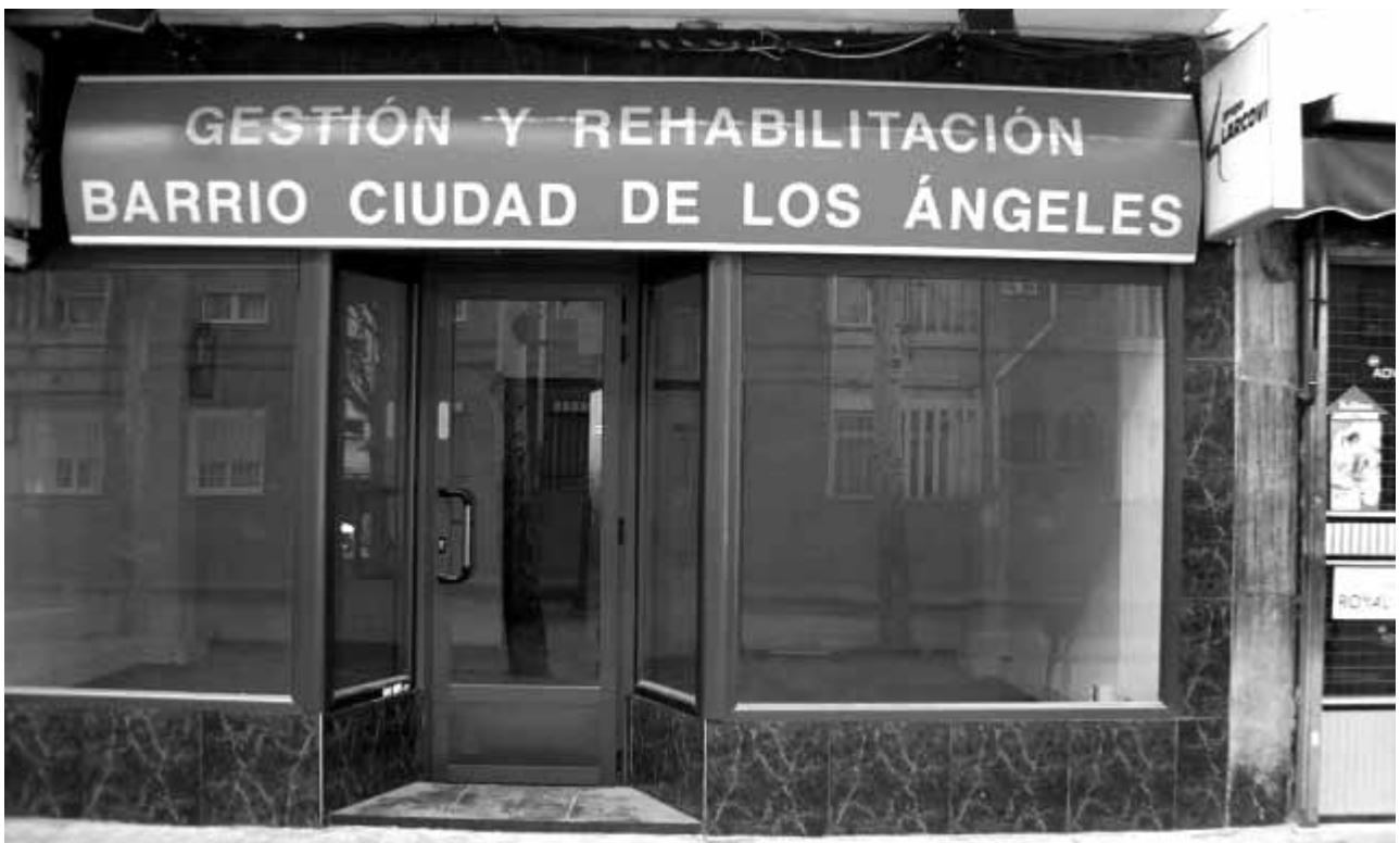
Oficina de rehabilitación de Ciudad de los Ángeles (Villaverde), antes de su inauguración.

El 31 de mayo pasado tuvo lugar la primera reunión de la comisión bilateral ministerio de Vivienda-Comunidad de Madrid para determinar la programación de los respectivos planes de vivienda 2005-2008. Uno de los acuerdos del encuentro hizo saltar las alarmas de varias asociaciones de vecinos y de la FRAVM: 15.000 viviendas quedaban al margen de las ayudas estatales a la rehabilitación.