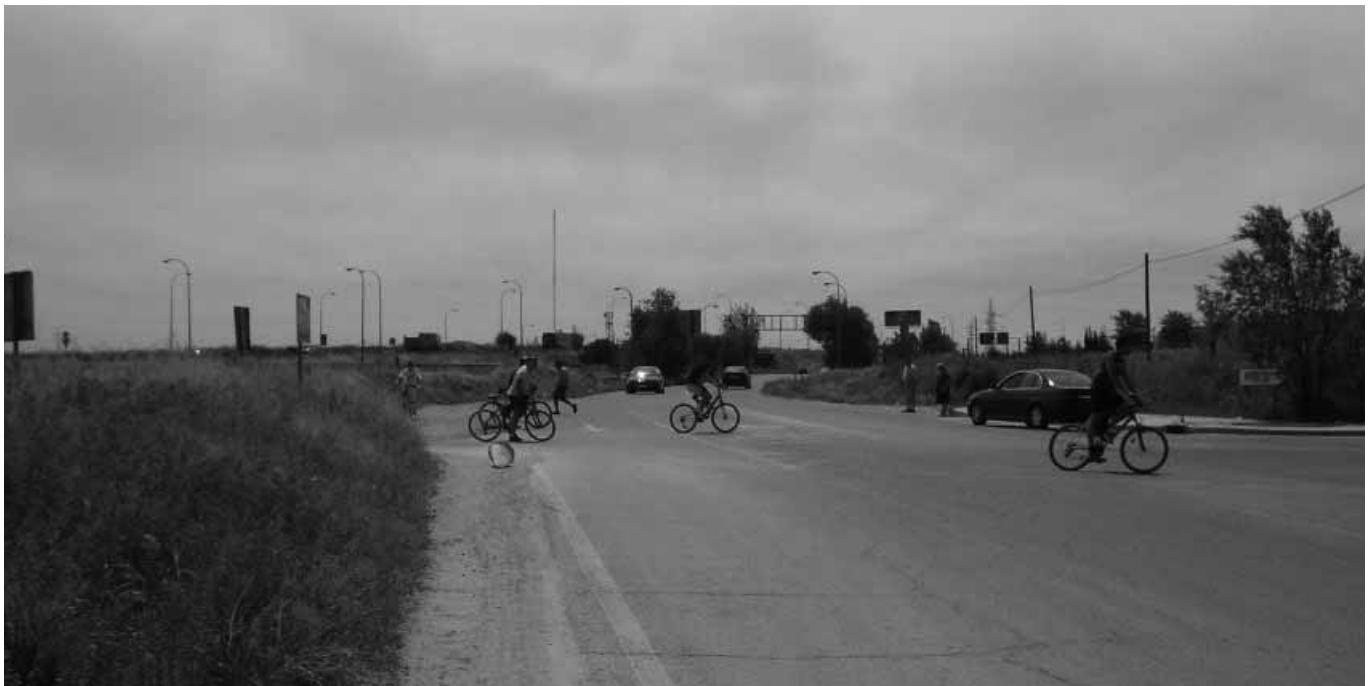
La avenida de los Rosales no tiene un sólo paso de cebra en 800 metros.

Las obras de remodelación de la avenida de los Rosales, una de las actuaciones incluidas en el Plan de Inversiones de Villaverde-Usera (Plan 18.000) fueron adjudicadas por la Comunidad de Madrid en el año 2002 pero nunca se llegaron a llevar a cabo. Cuatro años después, la situación de abandono e inseguridad que en su momento denunciaron los vecinos es, si cabe, más alarmante.