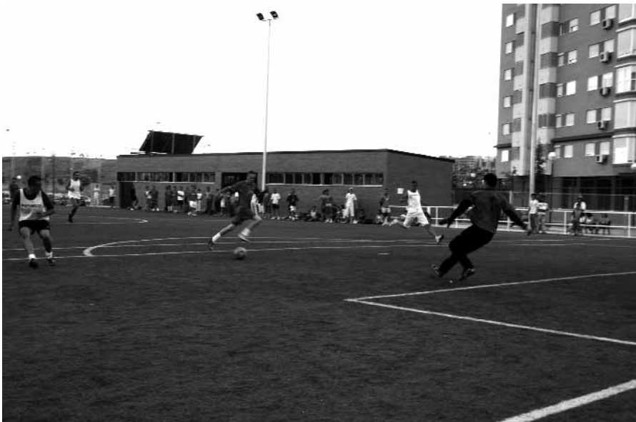
Campeo de fútbol de la calle Ontanilla, en Carabanchel.

Entre tanto, el proceso de negociación y seguimiento de los planes está haciendo las veces de escuela de participación y negociación y sirven para implicar más aún a las entidades ciudadanas en el conocimiento de las necesidades de sus barrios y en la configuración de sus territorios en base a las necesidades reales del vecindario. Un viaje largo y no exento de contratiempos, pero apasionante y necesario.