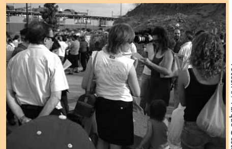
Los intereses de las vecinas y vecinos de Alcorcón no coinciden con los del Ayuntamiento.

ARPEGIO, y 720 viviendas libres en la parcela 76 de la sociedad Sacresa/Tesana 97 —objeto del convenio que se somete a información pública—. La parcela 74 obtiene otros 37.220 m 2 edificables: 15.300 para uso dotacional privado de ocio y 21.920 para uso comercial. No sólo eso: el nuevo desarrollo eleva las alturas de la edificación hasta las 16 plantas, 10 por encima de las viviendas vecinales.