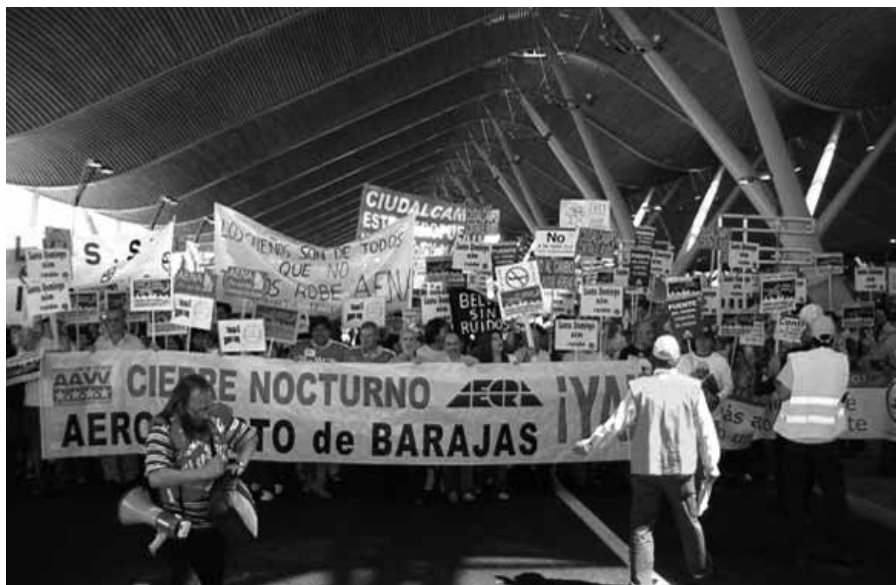
Cabecera de la concentración celebrada el pasado 3 de junio en la T-4.

El organismo representativo de los aeropuertos europeos, Airports Council Internacional-Europa, acompaña estas tesis con una petición: la armonización de las normas medioambientales concernientes al ruido y a las emisiones de los aviones ya que, de lo contrario, se producirán desventajas económicas y distorsiones de competencia en detrimento de los países más concienciados con el respeto al medioambiente y la salud de sus ciudadanos. Parece que, mientras nuestros gobernantes no se decidan a trasladar a la práctica su discurso sobre la protección del medio ambiente, la competitividad de nuestro país está asegurada.