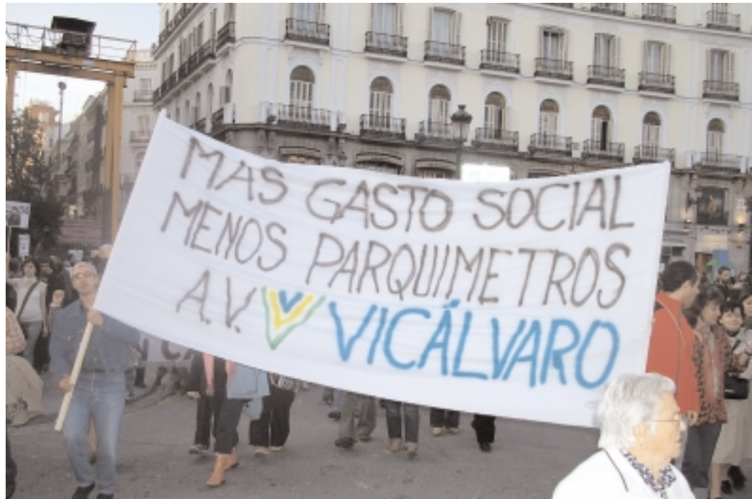
Pancarta de la Asociación de Vecinos de Vicálvaro en una de las manifestaciones contra los parquímetros en los barrios periféricos.