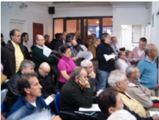
Asamblea sectorial en FRAVM de 16 de enero de 2007 sobre los consejos territoriales de participación ciudadana

Un puñado de ejemplos que ilustran "la frustración" vecinal, helos aquí.