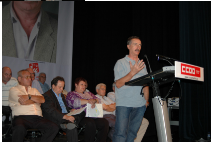
Tres horas después, todo el mundo sigue allí.