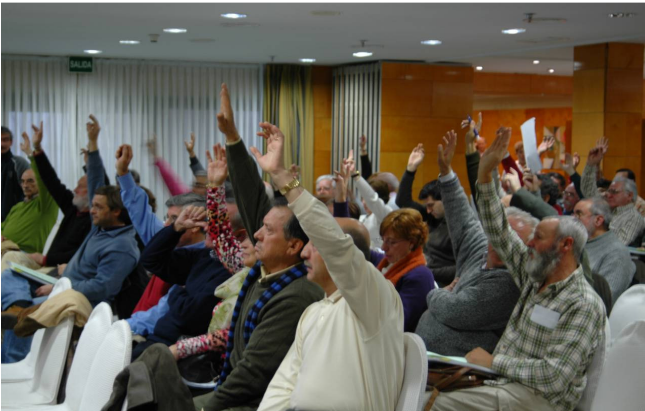
Asamblea general de la FRAVM de 13 de diciembre de 2007