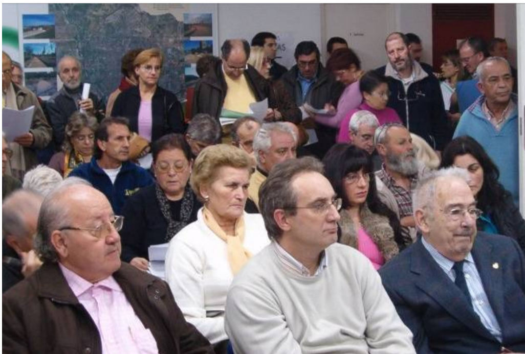
Asamblea sectorial en FRAVM de 16 de enero de 2007 sobre los consejos territoriales de participación ciudadana, en la que participaron sesenta asociaciones vecinales federadas de la ciudad de Madrid

En el año 2005 se pusieron en marcha los consejos territoriales (CT) de los distritos de la ciudad de Madrid, amparados en el artículo 54 y siguientes del Reglamento Orgánico de Participación Ciudadana de 2004 y dotados de su propio reglamento de funcionamiento. En las elecciones habidas para determinar su composición, las asociaciones federadas obtuvieron en 13 distritos la vicepresidencia del consejo territorial, en 15 distritos la portavocía y ocuparon en 8 distritos la vicepresidencia y la portavocía simultáneamente.