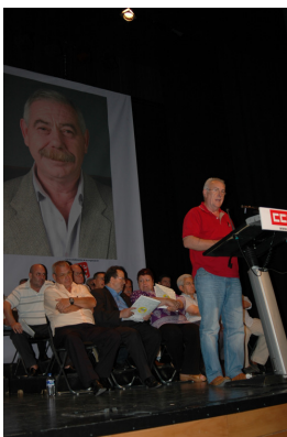
Intervención de Cayo Lara, coordinador general de IU. Abajo, Paco Frutos, secretario general del PCE.. Ambos recorren la contribución de tantos militantes, sindicalistas y activistas vecinales a la consecución de los derechos y libertades democráticas.